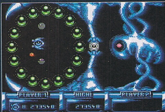
Der personifizierte Alptraum

gewappnet kann ich die künftigen Stacheln rechtzeitig erkennen und mit einem gezielten Schuß eliminieren. Um vor Thunderworms geschützt zu sein, halte ich mich möglichst mitten im Geschehen auf. Mein Glück, denn zwei besonders schöne Exemplare umkreisen mich prompt. Nach diesem Schreck noch ein paar Düsenjäger zum Teufel gejagt und ich bin fast am Ziel.