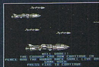
IO ist geschafft, die menschliche Rasse lebt

Glücklicherweise bringt das Wesen jetzt auch nicht mehr allzuviel. Ich konzentriere mich also darauf, seine Augen zu treffen, um dem Spuk endlich ein Ende zu machen. Mit unendlicher Freude sehe ich, wie sich das Wurzelwesen unter großem Radau in seine Bestand-