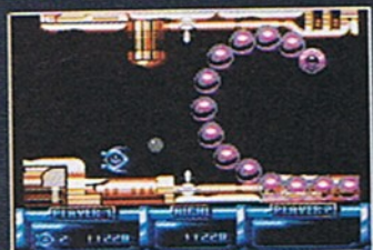
Thunderworms sind nicht zu unterschätzen

mal nutze ich die geringe Zeit, um meinen Gegner zu studieren. Und siehe da, ich entdecke gewisse Regelmäßigkeiten: Zunächst einmal muß der Rumpf in Stücke geschossen werden. Dann gilt es, die