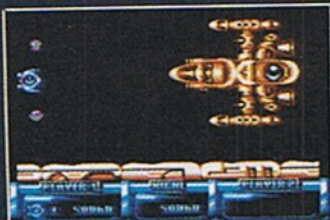
Ein riesiges Insekt am Ende des ersten Levels

Seitenteile (oben und unten) durch Schüsse in den Laserschacht abzutrennen. Als ich auch das geschafft habe, fliegen mir die letzten Kraftreserven des fast geschlagenen Monsters um die Ohren: Eine