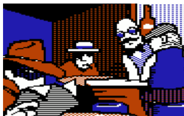
Sogar in meiner Stammkneipe werde ich beobachtet

In meiner Not schnitt ich das Kabel mit der Scherbe durch und war die Verfolger für eine Weile los. Unten in der Bar bekam ich den ersten Hinweis: Mavis, die Bedienung meiner Stammkneipe, sagte mir, dass einer von Farnhams Leuten, Charlie Lebock, eine Bemerkung gemacht haben soll, dass ich keinen Auftrag mehr würde zu Ende führen können. Nach einem Scotch fühlte ich mich besser und begann ein Gespräch mit einem der Gäste. Als der pampig wurde, zeigte ich ihm meine Pistole, woraufhin er etwas gesprächiger wurde. Als ich sie ihm noch ein zweites Mal zeigte, wurde er sogar noch gesprächiger und gab mir wertvolle Hinweise. Ich wusste nun, dass Lebock an der nördlichen Hauptstraße wohnte und ich als Passwort „Tinplayer“ sagen musste.