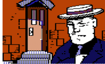
Jede Menge zwielichtige Gestalten tummeln sich in der Stadt

Was nun? Rita entführt, ich selbst verfolgt von Farnhams Schlägern, verbrannte Hände – nur Lisa, meine 45er, hielt scheinbar noch zu mir. Um meine Gedanken zu sammeln, streifte ich durch die Stadt. Dabei merkte ich, dass es meinen Händen schon besser ging und mich die Bandagen behinderten. Ich warf sie weg. In einem Müllhaufen entdeckte ich einen Knochen, den ich mitnahm. Meiner Erfahrung nach liebten Hunde solche Knochen, vielleicht konnte er mir also noch mal nützlich werden.