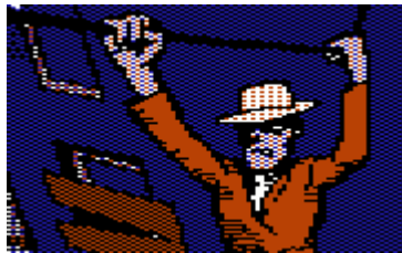
Die Verfolger sind hartnäckig

Nun blieb mir nur der Weg hinauf in die Dachkammer. Da ich die Mörder hinter mir wusste (sie schlugen bereits die Tür ein), zerbrach ich das Fenster, nahm trotz meiner Eile noch eine Glasscherbe mit und hangelte mich das Stromkabel entlang auf die andere Straßenseite. Ich befand mich nun über der „Dublin Rose Bar“, wo ich jetzt liebend gerne einen Drink zu mir nehmen würde – leider folgten mir meine Wadenbeißer.