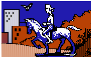
George Washington, der „Landesvater“

Als die Polizei eingetroffen war, ließ ich Rita und Wainwright bei ihnen zurück und widmete mich wieder dem Problem „Farnham“ zu.